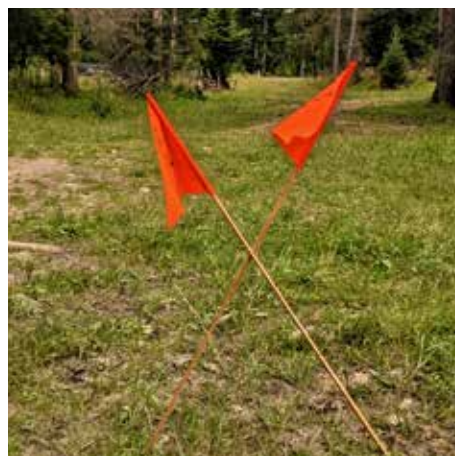
NIE BIEGNIJ TAM